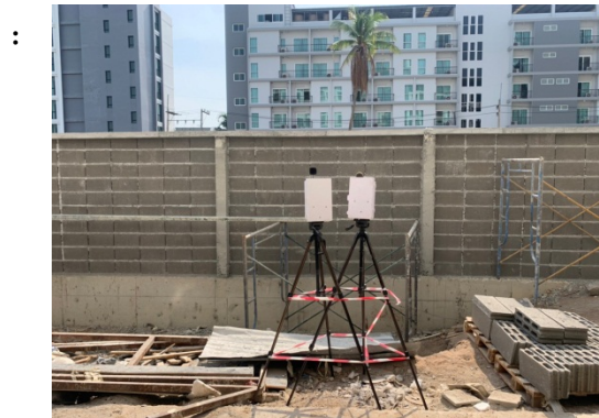
จุดที่ 1 บริเวณพื้นที่โครงการ