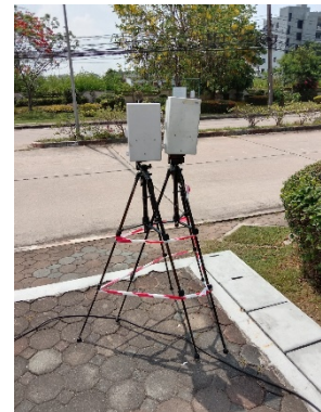
จุดที่ 2 บริเวณหมู่บ้านเพลินใจ 2