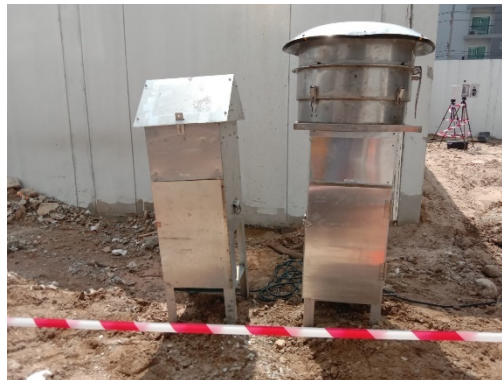
จุดที่ 1 บริเวณพื้นที่โครงการ