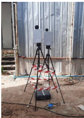
จุดที่ 1 บริเวณพื้นที่โครงการ