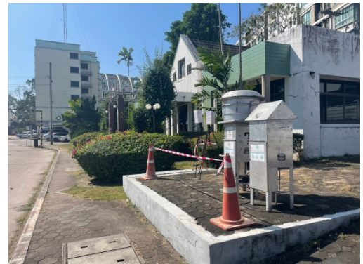
จุดที่ 2 บริเวณหมู่บ้านเพลินใจ 2