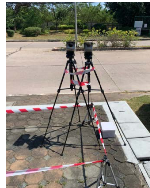
จุดที่ 2 บริเวณหมู่บ้านเพลินใจ 2