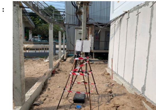
จุดที่ 1 บริเวณพื้นที่โครงการ