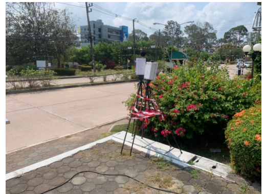
จุดที่ 2 บริเวณหมู่บ้านเพลินใจ 2