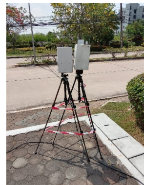
จุดที่ 2 บริเวณหมู่บ้านเพลินใจ 2