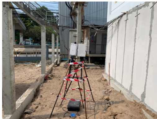
จุดที่ 1 บริเวณพื้นที่โครงการ