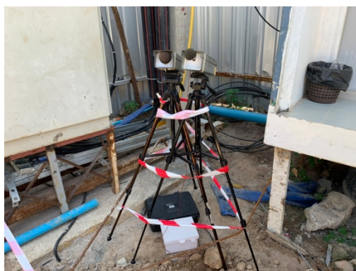
จุดที่ 1 บริเวณพื้นที่โครงการ