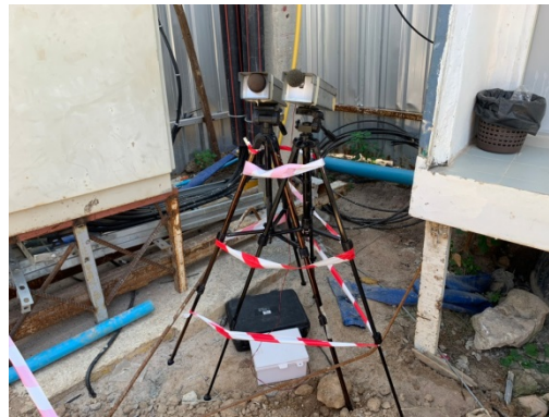
จุดที่ 1 บริเวณพื้นที่โครงการ