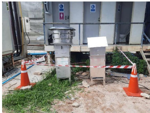
จุดที่ 1 บริเวณพื้นที่โครงการ