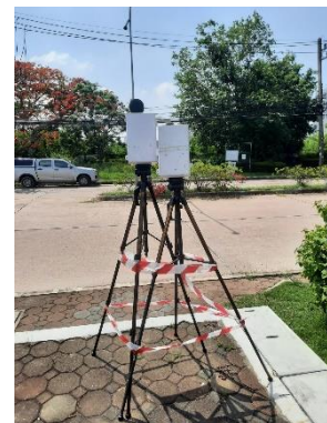
จุดที่ 2 บริเวณหมู่บ้านเพลินใจ 2