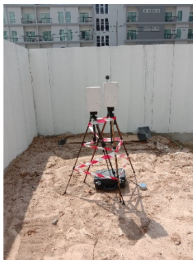
จุดที่ 1 บริเวณพื้นที่โครงการ