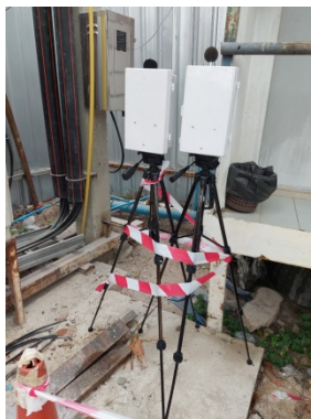
จุดที่ 1 บริเวณพื้นที่โครงการ