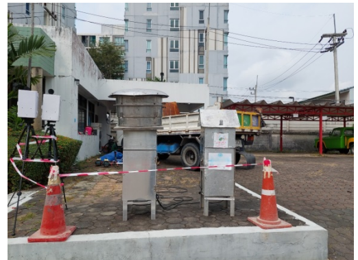
จุดที่ 2 บริเวณหมู่บ้านเพลินใจ 2