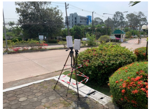
จุดที่ 2 บริเวณหมู่บ้านเพลินใจ 2