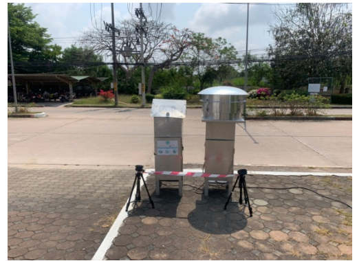
จุดที่ 2 บริเวณหมู่บ้านเพลินใจ 2