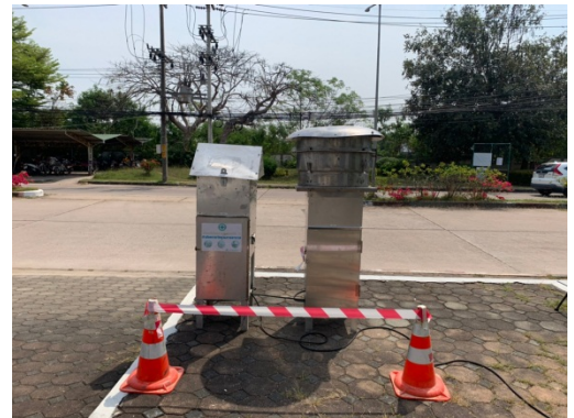
จุดที่ 2 บริเวณหมู่บ้านเพลินใจ 2