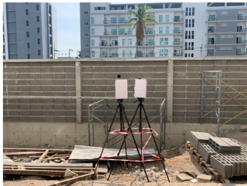
จุดที่ 1 บริเวณพื้นที่โครงการ