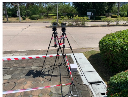
จุดที่ 2 บริเวณหมู่บ้านเพลินใจ 2