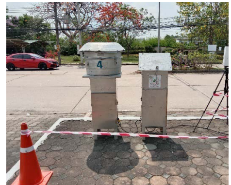
จุดที่ 2 บริเวณหมู่บ้านเพลินใจ 2