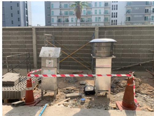
จุดที่ 1 บริเวณพื้นที่โครงการ