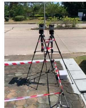
จุดที่ 2 บริเวณหมู่บ้านเพลินใจ 2