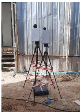
จุดที่ 1 บริเวณพื้นที่โครงการ