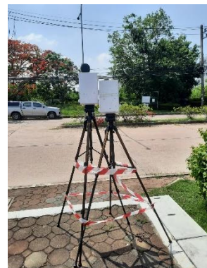
จุดที่ 2 บริเวณหมู่บ้านเพลินใจ 2