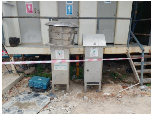
จุดที่ 1 บริเวณพื้นที่โครงการ