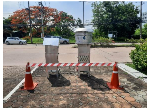
จุดที่ 2 บริเวณหมู่บ้านเพลินใจ 2