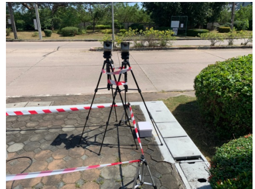
จุดที่ 2 บริเวณหมู่บ้านเพลินใจ 2