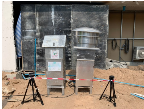
จุดที่ 1 บริเวณพื้นที่โครงการ