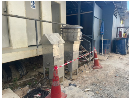
จุดที่ 1 บริเวณพื้นที่โครงการ